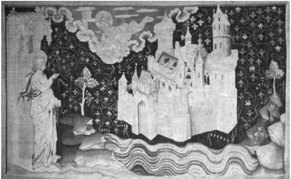
Nicolas Bataille - Das Neue Jerusalem

Augenscheinlichstes Bild dazu ist für mich der Gedenkstein vor der evangelischen Kirche St. Ulrich in Neckargemünd. Auf dieser Mahntafel wird der Opfer der Kriege des letzten Jahrhunderts, der Opfer der Vernichtung, des Terrors und der Unmenschlichkeit gedacht. Ihnen allen miteinander ist diese Tafel gewidmet. Überschriften ist sie mit einem Teil des oben genannten Textes: