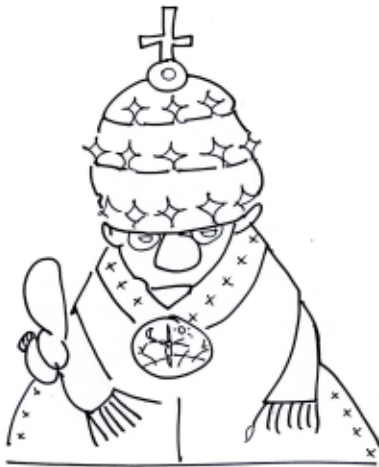
Grüß aus Rom.

Zu wirksamen politischen Volkswahlen kommt es dann allerdings in Deutschland erst nach der Französischen Revolution. Am 24. Februar 1793 wird die Mainzer Republik