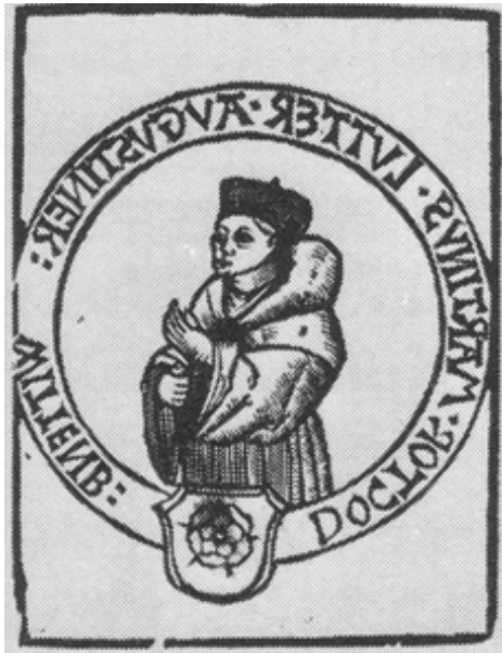
Älteste Darstellung Luthers auf dem Titelblatt des Drucks der in Leipzig am Peter- und Paulstag, dem 29. Juni 1519, gehaltenen Predigt (mit spiegelverkehrt geschnittener Umschrift)

punkt in einer umfangreichen Thesenreihe dar. Dagegen wiederum wehrte sich der von Karlstadt angegriffene Ingolstädter Theologieprofessor Johannes Eck, der in den folgenden Jahren der wichtigste und gelehrteste altgläubige Gegner der Reformation werden sollte. Weil es um Fragen ging, welche die Menschen existentiell betrafen, wurde aus dem Streit der Theologieprofessoren schnell eine öffentliche Debatte. So ging es um die Frage, ob der Mensch irgendwie dazu beitragen könnte, zum Heil zu gelangen, oder ob das allein an Gottes Barmherzigkeit hänge. Auch ging es um die Frage, ob das sakramentale Handeln des Priesters in der Taufe die Sünde auslösche oder ob der Mensch sein ganzes irdisches Leben immer von neuem aus seinem Egoismus befreit werden müsse. Und schließlich ging es auch um die Autorität des Papstes und des priesterlichen Amtes: Gab es auch unabhängig davon einen authentischen, lebendigen Glauben, als Wirkung des göttlichen Geistes?