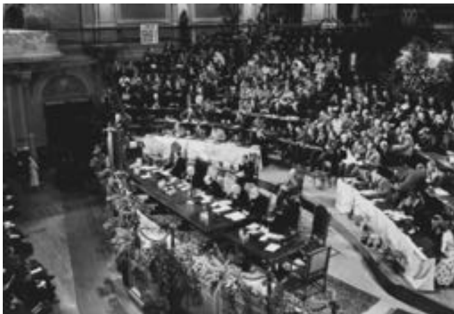
1. Vollversammlung des Ökumenischen Rates der Kirchen in Amsterdam, Niederlande, 1948

In Deutschland hatten es diejenigen, die in der ökumenischen Bewegung mitarbeiteten, anfangs schwer. Denn sie wurden in der Zeit der Weimarer Republik als „Vaterlandsverräter“, die sich zu Ausführungsgehilfen des von den Siegermächten nach dem verlorenen Ersten Weltkrieg Deutschland auferlegten Versailler Vertrags von 1919 machten, denunziert. Das erlebte zum Beispiel Dietrich Bonhoeffer. Er wurde nach einem USA-Aufenthalt Anfang der 1930er Jahre als junger Dozent – wegen seiner Auslandserfahrung und Sprachkenntnisse – gebeten, in der ökumenischen Bewegung mitzuarbeiten. Er tat das mit großem Engagement und hat hier wertvolle Anregungen und freundschaftliche Kontakte gewonnen, die ihm noch in der Zeit des Widerstands in den 1940er Jahren nutzten.