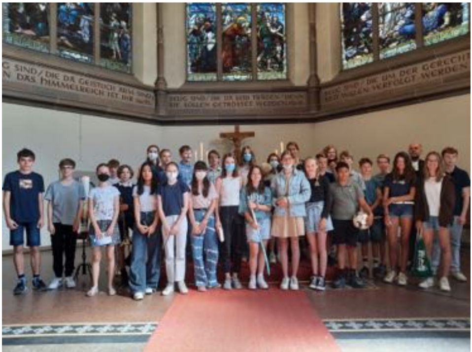
Konfirmandinnen und Konfirmanden 2022/23