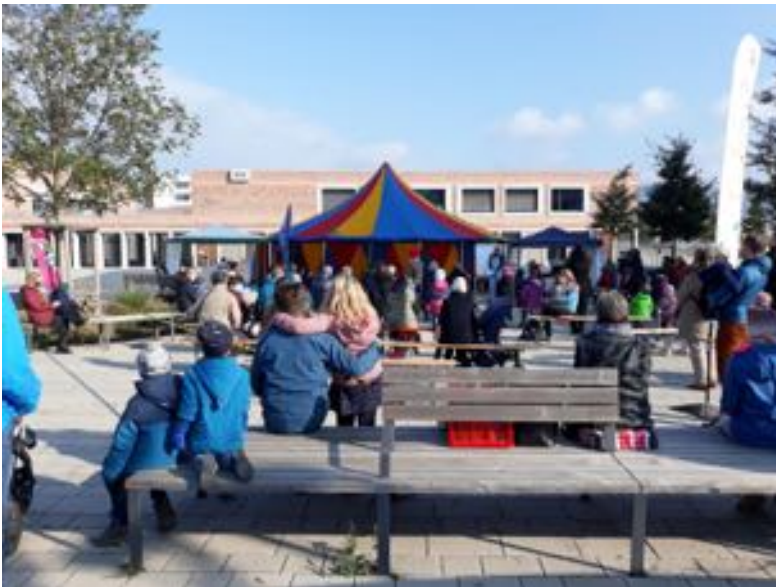
Zirkuswochenende 2020