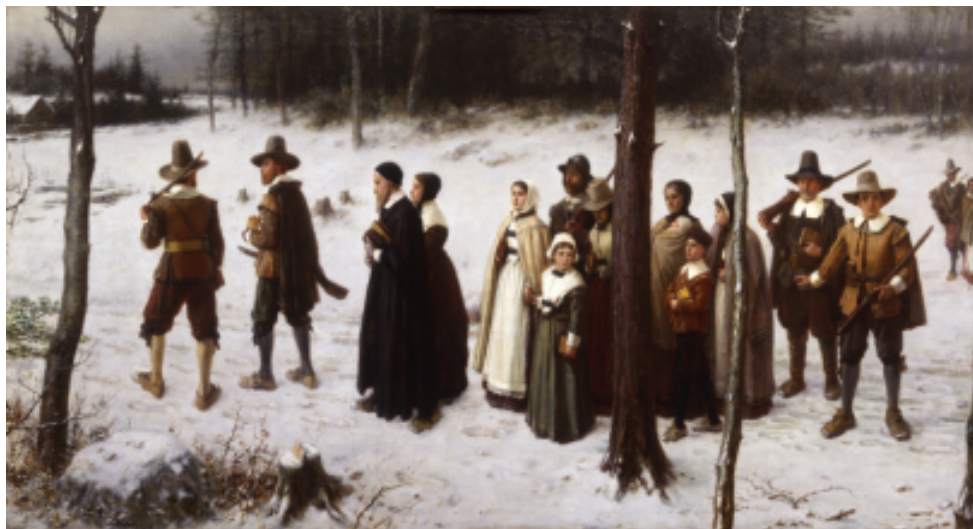
Pilger auf dem Weg zur Kirche, Gemälde von George Henry Boughton, 1867

Martin Luther hatte eine grundsätzliche Abneigung gegen das Bestreben, alles mit religiös begründeten Vorschriften und Gesetzen zu regeln. Er sah die Gefahr, dass dadurch das Eigentliche, nämlich das Evangelium, die frohe Bot-