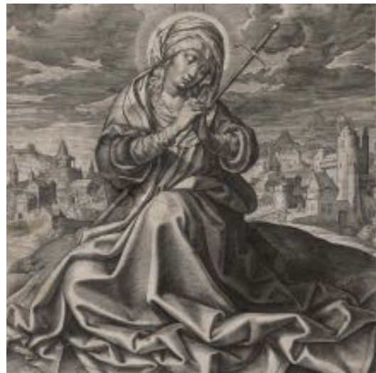
Hieronymus Wierix, Mater Dolorosa, Stich c.1585

Knüpft die Befreiungstheologie in ihrer Identifikation mit Maria noch unmittelbar an neutestamentliche Texte an, ist die Geschichte der Marienfrömmigkeit voll von Beispielen ohne direkten biblischen Bezug. Eines der eindrucklichsten ist die Gestalt der Schmerzensmutter, der Mater dolorosa , die ihren toten, vom Kreuz abgenommenen und nun in ihren Armen liegenden Sohn beweint. Das Motiv wird auf die Begegnung Marias mit Simeon zurückgeführt, der ihr bei Jesu Darstellung im Tempel prophe-