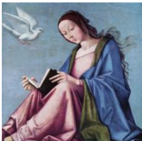
Lorenzo Costa, Maria Verkündigung (lesende Madonna) , 1. Drittel 16. Jahrhundert

Ohne jeden biblischen Bezug ist dagegen ein anderes Motiv, das in der Entfaltung der Marienfrömmigkeit gleichwohl eine große Bedeutung hat: die lesende Maria. Mittelalterliche Meister haben es auf ihren Gemälden vielfach in Szene gesetzt. Maria liest, als der Engel der Verkündigung sie in ihrer Kammer aufsucht, sie liest nach der Geburt