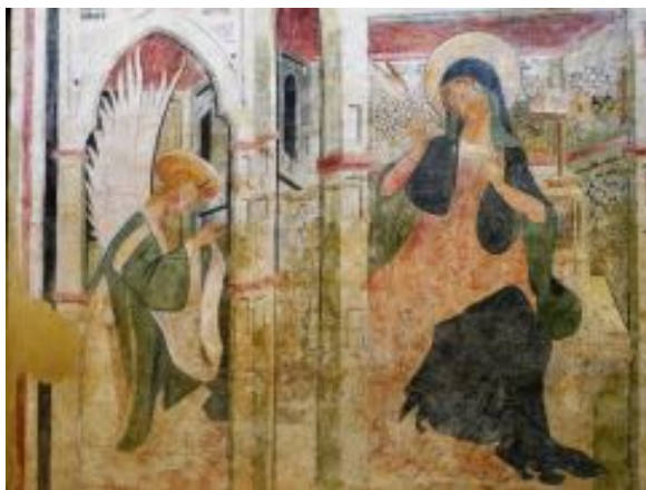
„Verkündigung“, Fresco in der Basilica San Pietro in Otranto, Apulien

leitet das neue Leben ein. Ein Zuspruch, den jede Frau, die schwanger ist, braucht. Fürchte dich nicht, sei gewiss, dass du es schaffst, eine gute Mutter zu sein. Maria ist eine Frau wie wir. Und sie