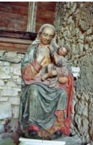
Maria und Jesus, barocke Skulptur in der Bretagne; Foto: Barbara Coors

vom Heiligen Geist erfüllt und rief laut und sprach: Gesegnet bist du unter den Frauen, und gesegnet ist die Frucht deines Leibes!