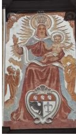
„Maria Himmelskönigin am „Marienurm“ in Wangen/ Allgäu

So berichtet die Apostelgeschichte . Frauen haben die Auferstehung als Erstes be-