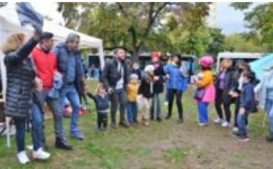
Interkulturelles Fest

gegenüber Menschen zu praktizieren, die vor Krieg, Gewalt, Hunger und Perspektivlosigkeit zu uns fliehen. „Dass gut integrierte Menschen, die einem Beruf nachgehen und im kommenden Jahr unter das Chancen-Aufenthaltsgesetz fallen werden,