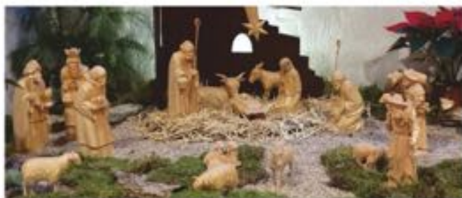
Krippe der Ek. Marienkirche, Ossebrück