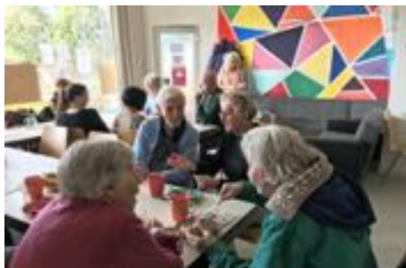
Interkulturelles Frühstück

Beim Interkulturellen Frühstück im Nachbarschaftsraum in Bergheim-West wurde es dann vor allem lokalpolitisch. Denn zu Gast war auch die Kandidierende für das Amt der Oberbürgermeisterin, Theresia Bauer. Sie nahm sich die Zeit für die Fragen und Anregungen der Teilnehmenden. Bei guter Stimmung und leckerem Frühstück war das sicherlich ein angenehmer Teil des Wahlkampfes.