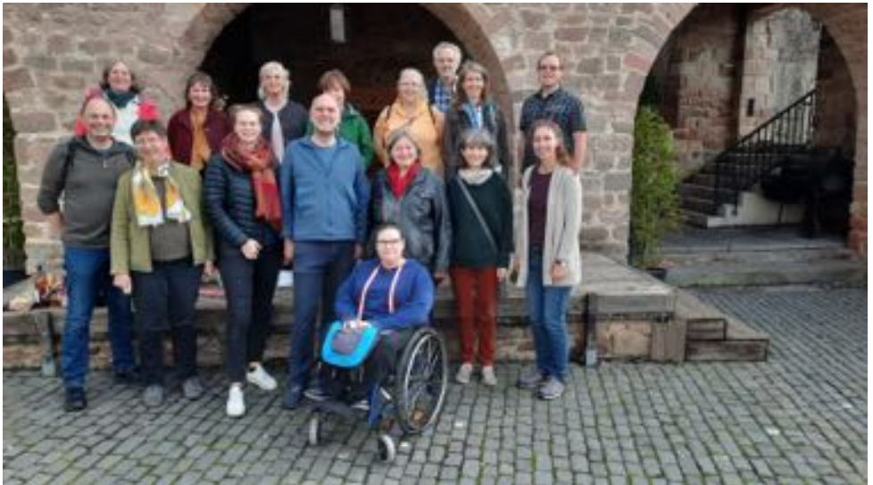
Der Ältestenkreis bei der Ältestenrüste