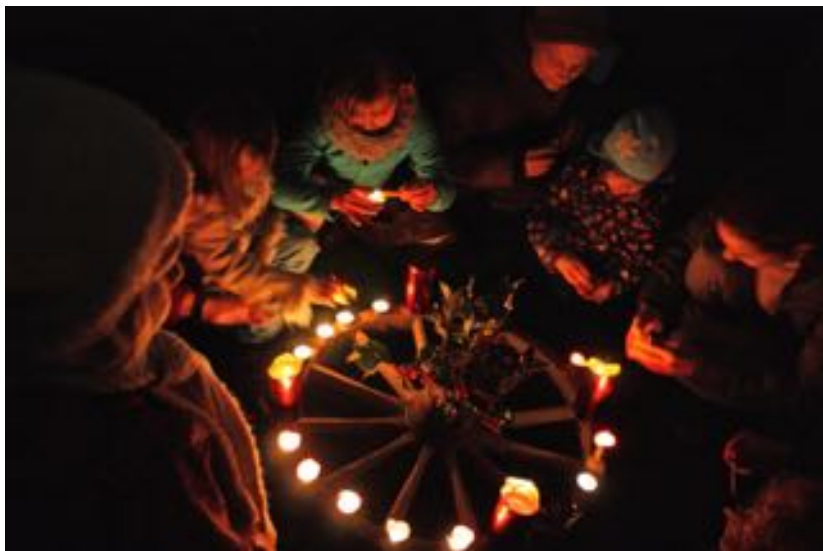
Lebendiger Adventskalender