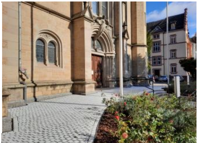
Rampe am Hauptportal

Die ausführenden Handwerksbetriebe arbeiteten sorgfältig und wurden häufig von Gemeindegliedern und Passanten auf ihre Arbeit angesprochen. Der Übergang zum Parkplatz ist noch nicht befriedigend