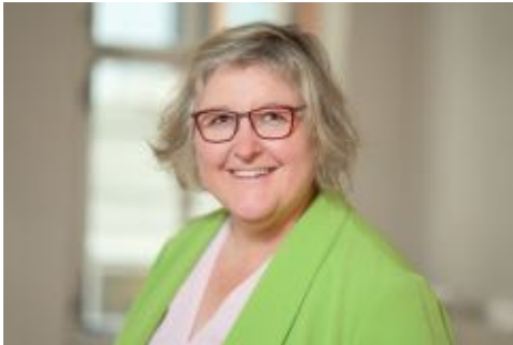
Heike Springhart

Die badische Theologin Heike Springhart (Pforzheim) und der Wiesbadener Dekan Martin Mencke kandidieren für das Amt der Bischöfin bzw. des Bischofs der Evangelischen Landeskirche in Baden . Sie bewerben sich um die Nachfolge von Landesbischof Jochen Cornelius-Bundschuh, der im April kommenden Jahres in den Ruhestand verabschiedet wird.