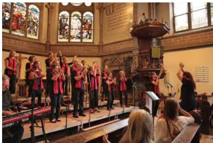
Gospelprojekt Heidelberg

Gospelkonzert: Sonntag, 25. Juni 2023, 19 Uhr in der Christuskirche