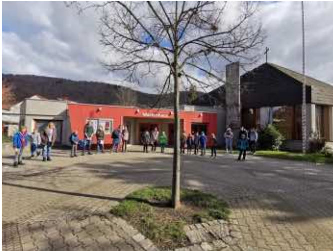
VCP-Stamm Alfons Beil

Du bist dir noch unsicher, wer ich bin? Mein Name ist Robert Baden-Powell, ich gründete im Jahr 1906 die Pfadfinderbewegung. Es freut mich, dass viele Pfadfinder auf der ganzen Welt meinen Geburtstag im Februar mit eben solchen Aktionen feiern. Besonders hat mich gefreut an dieser Aktion anwesend sein zu dürfen.