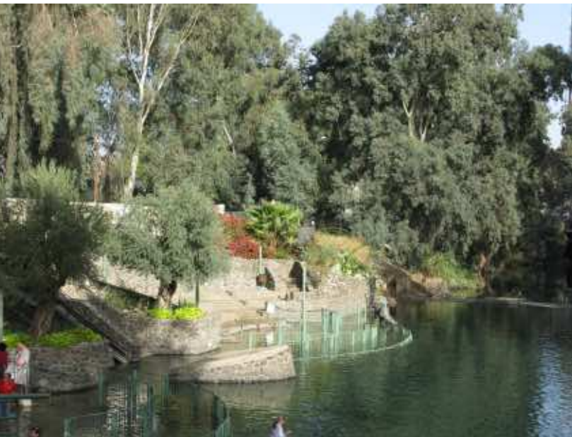
Moderne Taufstelle am Jordan

Kirchen und Konfessionen hinweg. Schon im Epheserbrief heißt es prägnant: Ein Herr, ein Glaube, eine Taufe (Epheser 4,5). Die Taufe verbindet uns nicht nur mit Jesus Christus, und auch nicht nur mit der Gemeinde, zu der wir jeweils gehören. Sie