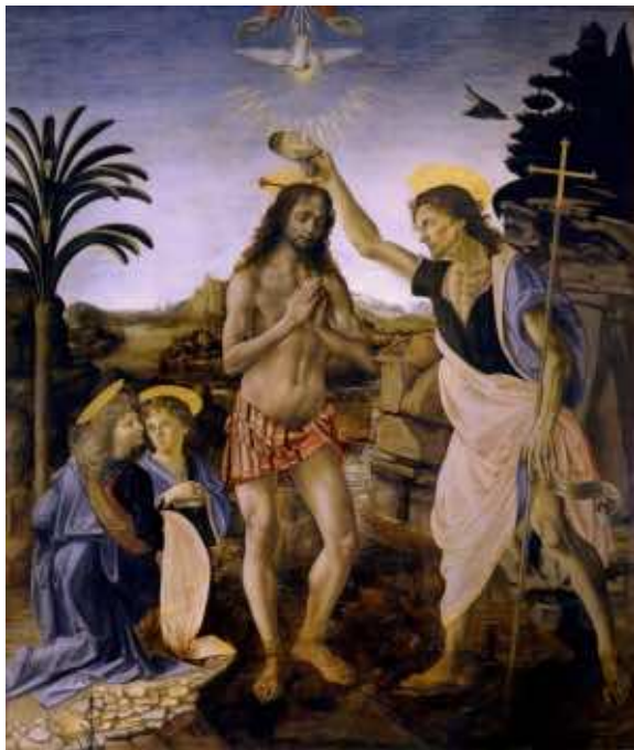
Andrea del Verrocchio und Leonardo da Vinci: Taufe Christi

entschieden sich Menschen als Erwachsene zur Taufe. Nur in Einzelfällen mögen auch Kinder getauft worden sein, wenn sich etwa ein Familienoberhaupt mit seinem oder ihrem „ganzen Haus“ taufen ließ (Apostelgeschichte 16,15). Die Taufe wurde nicht als Ritus zur Geburt angesehen, sondern als Feier der Wiedergeburt. Die Praxis war, dass Menschen bei der Taufe ganz untergetaucht wurden. Ich stelle mir vor, dass dieses Untertauchen für die Menschen, die meist nicht schwimmen konnten, ein angespannter Moment war. Paulus kann diese Erfahrung jedenfalls mit dem Untergehen und Sterben vergleichen, und entsprechend das wieder Auftauchen mit neuem Leben und Auferstehung (Römer 6,4).