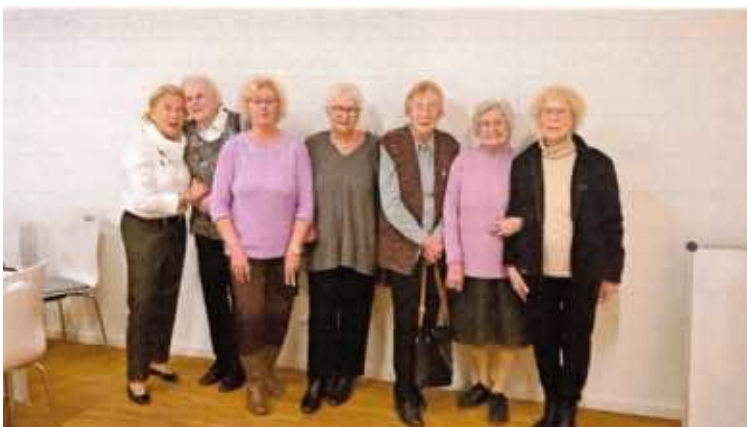
Die Dienstagsrunde damals und heute