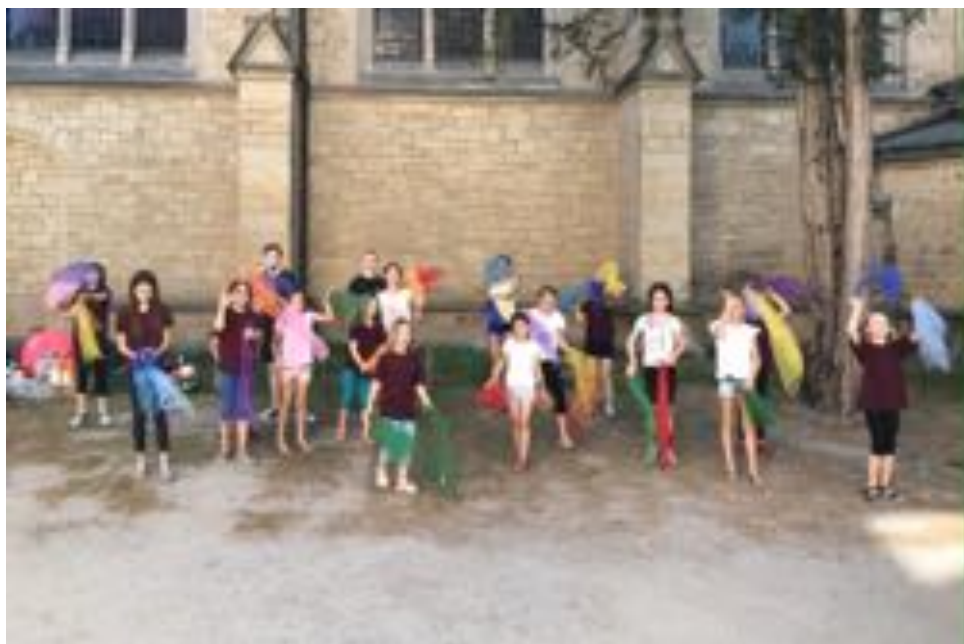
Jahresauftritt 2019.

Von Forschern, die neue Paradiesvögel entdecken, gemütlichen Pandabären und ge-