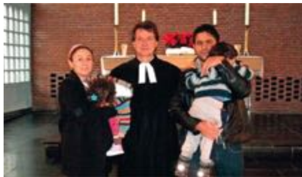
Kirchenasyl in Cuxhaven 2012.

(Reinhard Kardinal Marx, ehemaliger Vorsitzender der Deutschen Bischofskonferenz, ebenda)