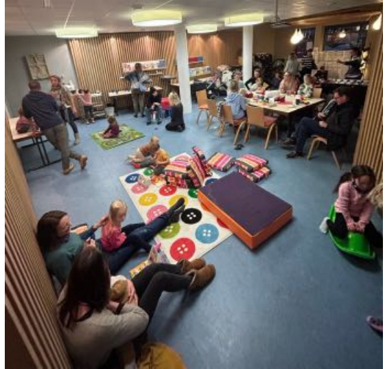
Offener HALT.