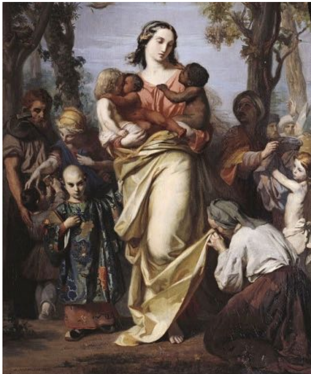
Bildausschnitt: Allegorie der Nächstenliebe, Alexandre Laemlein (Öl auf Leinwand, 1845), Bildrechte: gemeinfrei

Bei Aristoteles gilt das für Freunde. Unsere Jahreslosung aber sagt: Alles geschehe in dieser Liebe. Heißt das, sie soll auch denen gelten, die unser Leben und Zusammenleben lieblos zerstören, uns Böses wünschen und tun?