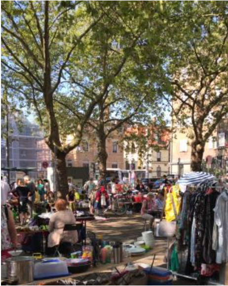
Flohmarkt vor der St. Albert- Kirche

chen. Und die Zimtschnecken des Familienzentrums waren unwiderstehlich.