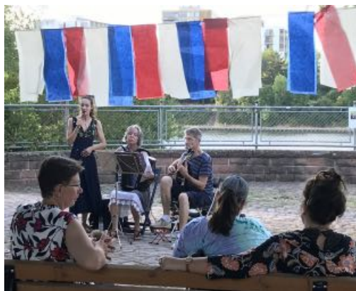
Sunset Spirit im Pentapark

Zum festen Jahresprogramm gehört auch der Sunset Spirit im Pentapark. Musik und Texte, Drinks und Fingerfood laden an einem schönen Sommerabend zum Genießen am Neckar ein.